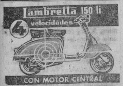
Lambretta 150 li con motor central

Baloncesto Resultados de los partidos de baloncesto. Categoría Infantil (B), celebrados ayer: Instituto de Enseñanza Media, 0; Taller Escuela «Angel del Alcázar», 2; Padres Misioneros, 2; Instituto de Enseñanza Media, 0. Hermanos Maristas, 2; Taller Escuela «Angel del Alcázar», 0. Padres Misioneros, 2; Hermanos Maristas, 0. Los Colegios de Padres Misioneros y Hermanos Maristas y el Taller Escuela «Angel del Alcázar» quedaron empatados a puntos. El próximo jueves se jugará una liguita entre los tres para la clasificación definitiva.