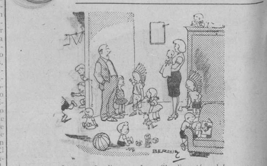
—¡La pequeña dice que Juan Claudio está malo! ¿Tenemos alguno que se llame Juan Claudio?

SU NOVIA... Espera ilusionada su obsequio. Una pulsera... una joya de ATALAYA, colmará su ilusión. ¡NO LA DESILUSIONE!