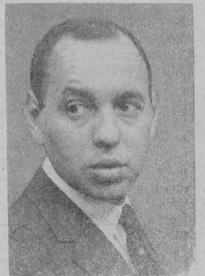
Hassan II, nuevo rey de Marruecos

El argumento británico es el de que la guerra fría será retenida en los próximos años, principalmente en el frente económico y que el resultado de la batalla económica determinará el equilibrio mundial de fuerzas del futuro.—Efe.