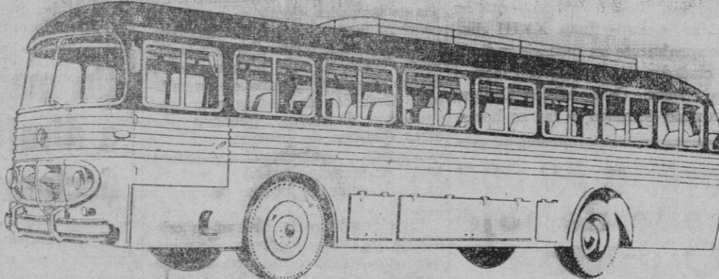
AUTOCAR CON MOTOR DE 120 CV. CARROCERIA METALICA

Precio del autocar CARROZADO: 898.000 pts. N.º de plazas disponibles: 39 pasajeros Consumo a los 100 Kms.: 20 litros gas-oil Peso del autocar a plena carga: 10.500 kilos