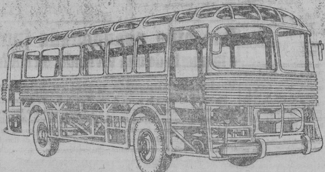
AUTOBASTIDOR: ESTRUCTURA MONOCASCO