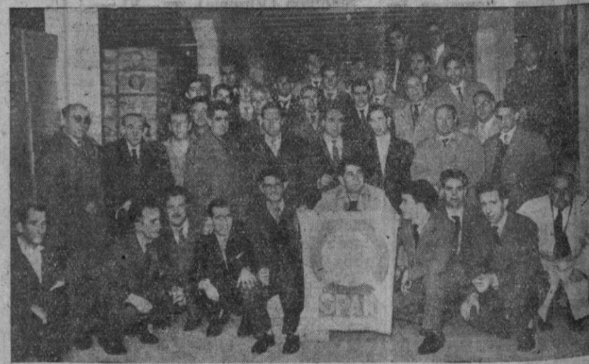
Grupo de detallistas segovianos que asistieron a la reunión de sparistas