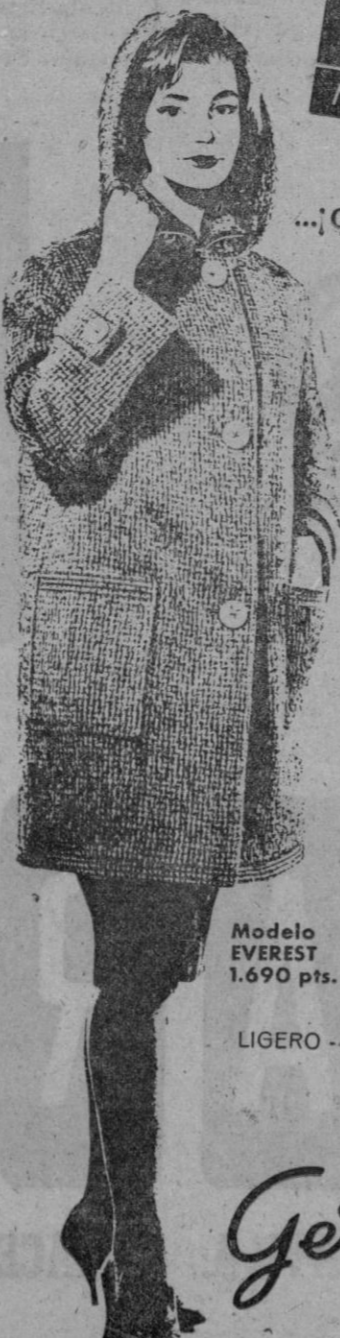
Modelo EVEREST 1.690 pts.

La prenda que se ha impuesto por el carácter verdaderamente distinguido que da a la mujer de hoy.