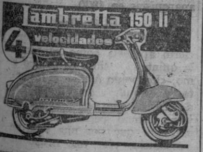
Lambretta 150 li. Velocidades.