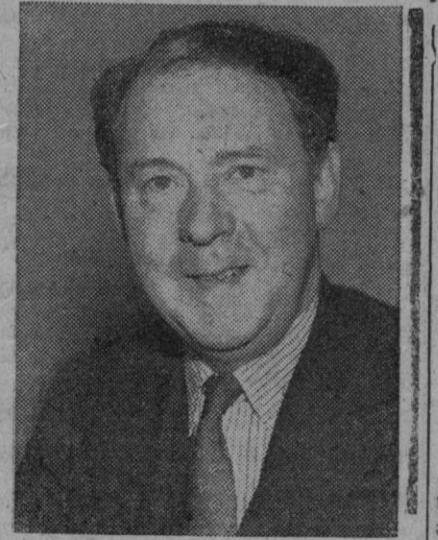
Hugh Gaitskell, líder del partido laborista inglés, en donde se produce actualmente una escisión

Hasta este momento, la Liga arroja 1.968.932 espectadores menos que la temporada pasada.—Alfi.