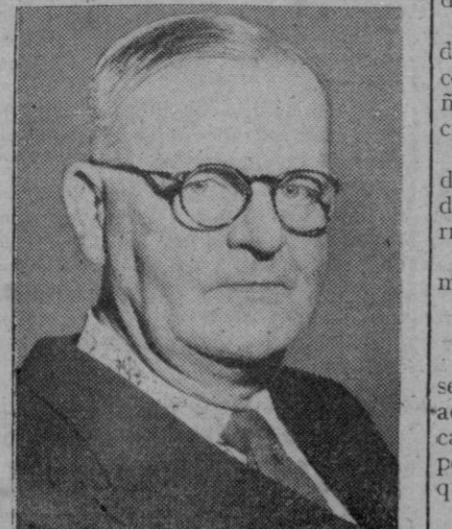
F. H. Boland, embajador irlandés en la O. N. U., que ha sido elegido presidente de dicha Organización internacional

Todo el mundo sospecha de todo el mundo.—Efe.