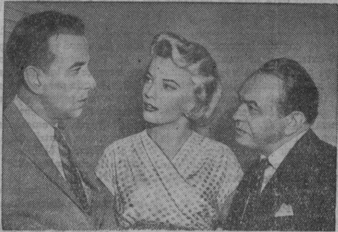
José Ferrer, el extraordinario actor de "Cyrano de Bergerac", "Moulin Rouge", "El motín del Caine" y "Yo acusó", va a intervenir como cantante en una temporada de ópera que se iniciará con la obra de Puccini, "Gianni Schicchi", y será dirigida por Igor Stravinsky. El notable actor portorriqueño tiene facultades como cantante que le harán triunfar también en esta nueva rula de su carrera artística.

José Ferrer aparece en el grabado junto a Gena Rowlands y Edward G. Robinson.