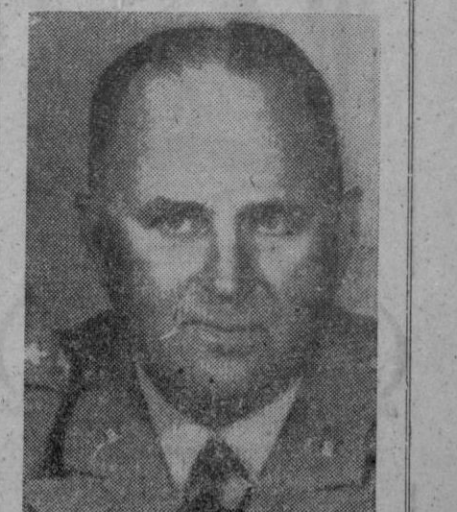
El general George H. Decker, nombrado por Eisenhower jefe del Estado Mayor del Ejército de los Estados Unidos, puesto en el que sucede al general Lemnitzer.