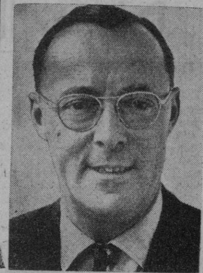
El príncipe Bernardo de Holanda, que ha recibido del Consejo de Europa el Premio Europa por sus esfuerzos en pro de la colaboración económica europea

gresaron a Huelva, donde se celebró un almuerzo en el salón de recepciones del palacio municipal, ofrecido por el gobernador civil. Terminado el almuerzo, los dos ministros marcharon a Ayamonte, en cuya ciudad el señor Rubio García-Mina despidió a su colega, señor Leite, regresando después a la capital y continuando viaje hacia Madrid.—Cifra.