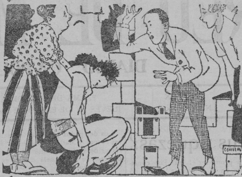
La vecina.—Es un pobre obrero, que acaba de caerse del piso quinto. Vaya usted a buscar un vaso de agua. El beodo.—¿Y... de qué..., de qué piso hay que caerse para que le den a uno un vaso de vino?

Enamorados del arte popular, convencidos de su valor artístico, veíamos comprobada una vez más