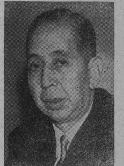
Nobusuke Kishi, primer ministro de Japón, a quien la oposición trata de obligar a aplazar la proyectada visita de Eisenhower a aquella nación

liicia ha declarado que diez policías han resultado heridos y tres personas fueron detenidas en el aeropuerto de esta ciudad con motivo de los incidentes ocurridos a la llegada del secretario de Prensa de la Casa Blanca, Hagerty.—Efe.