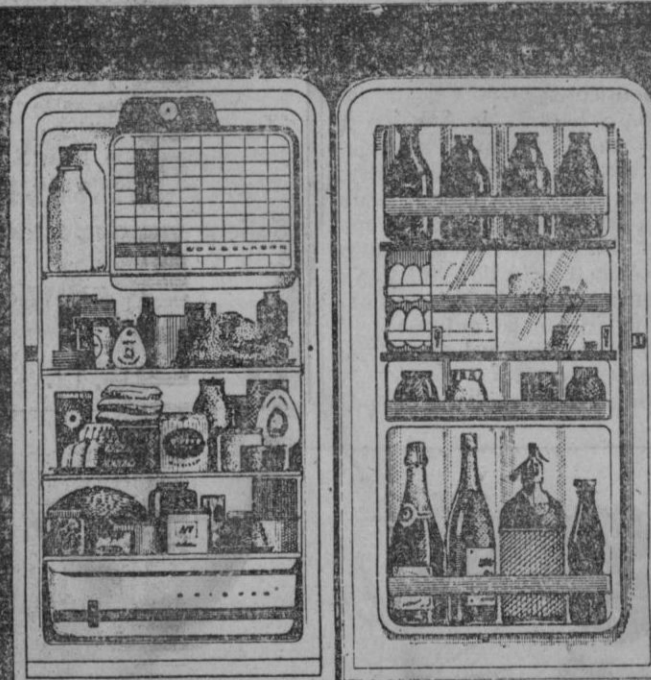
Modelo 177 litros de capacidad útil de almacenaje

EL FRIGORIFICO AMERICANO DE FAMA MUNDIAL