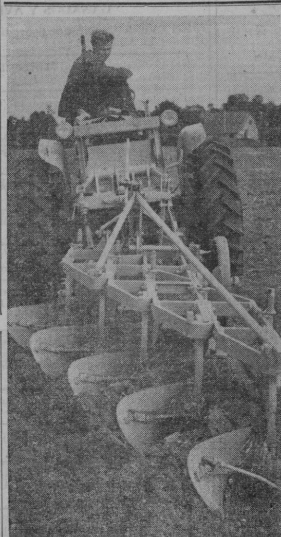
Equipado para muy diversas faenas agrícolas e industriales, este nuevo modelo de tractor "Centaur" puede dotarse de cinco rejas en uno u otro extremo. Tiene empalme a tres puntos con ambos extremos, para enganchar cualquiera de los aperos agrícolas ordinarios, incluyendo una barra de arrastre pesada, para tirar de un cultivador. La versión industrial de esta máquina tiene niveladora angular o guinche de una tonelada para troncos, o ambos. Si se requiere, el "Centaur" se puede suministrar con zanjadora hidráulica Sherman, combinación ésta que es utilísima para terrenos accidentados que impiden normalmente el desarrollo del convencional tractor y la zanjadora. Tiene transmisión a cuatro ruedas. Todas las versiones están propulsadas por Diesel Ford de 96 H. P. al freno y ejes pesados Bray, con reducción planetaria. La dirección es ayudada, y los frenos hidráulicos, ramificados a los cuatro tambores.

Señala la acusación que no sólo se hallan complicados en el complot terrorista los seguidores del ex presidente Perón, sino que tomaron parte en su organización y facilitaron armas y municiones.—Efe.