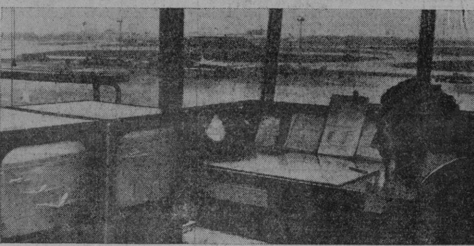
Con el aumento diario en el número de modernos aeroplanos a reacción, y otras aeronaves, que utilizan el aeropuerto de Londres, las autoridades tratan de mejorar el sistema de aparcado y el carreteo de los aparatos en las zonas de maniobras. Se está ahora realizando un experimento el cual, de dar positivos resultados, permitirá que los aviones que aterricen sean orientados hasta los parques de estacionamiento por medio de una televisión de circuito cerrado, dirigida por un director de maniobras, que aparece aquí observando una pantalla. Las órdenes se dan al piloto por radiotelefonía. En el experimento se han instalado dos cámaras, a ambos extremos de la zona principal, de aparcado, y fuera de la línea de visión directa del director de maniobras. Las señales de las cámaras se alimentan, a través de unidades de control, hasta pantallas monitoras situadas en el departamento principal de llegada y salida de viajeros. Las pantallas permiten al director ver las posiciones de los diversos aviones, y dirigirlos hasta las zonas de aparcado por radiotelefonía.

En los medios competentes se interpreta la medida comunista como un nuevo intento de terminar con el continuo flujo de refugiados que abandonan la zona oriental utilizando este medio de comunicación.