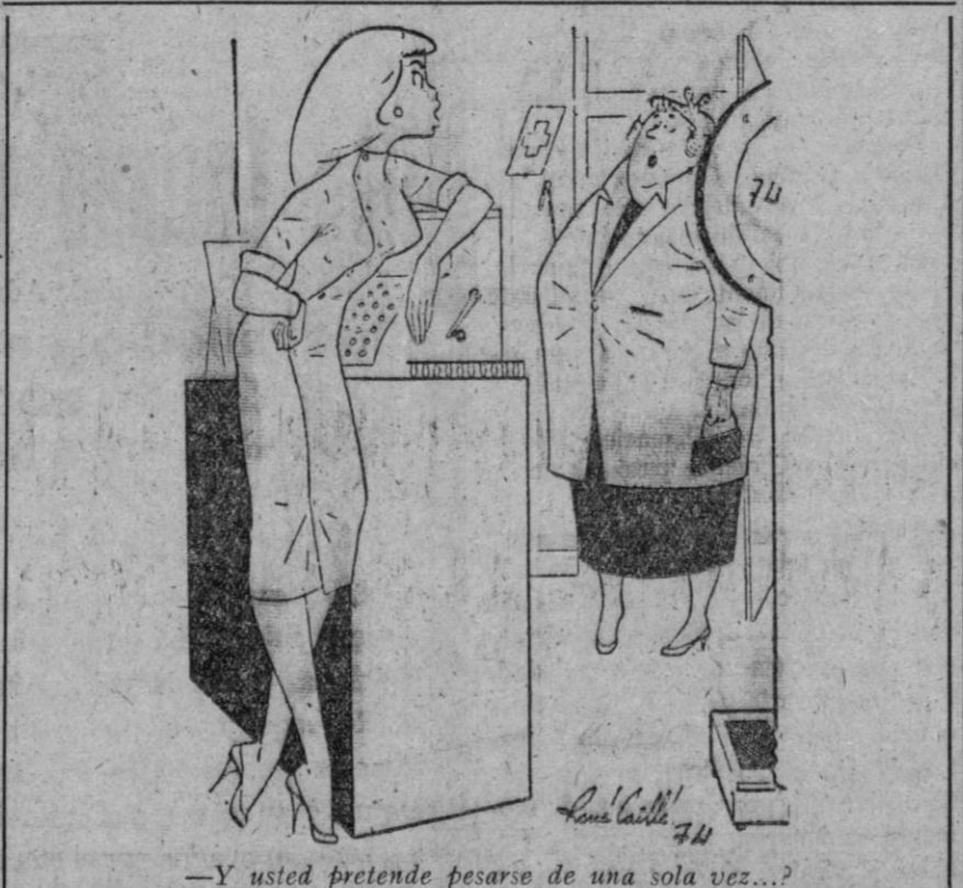
—Y usted pretende pesarse de una sola vez...?

Ahora puede adquirirla por 620 pesetas mensuales