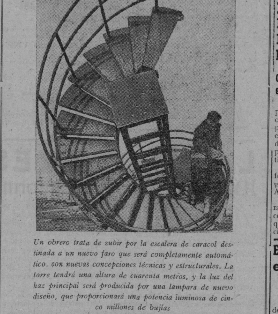
Un obrero trata de subir por la escalera de caracol destinada a un nuevo faro que será completamente automático, con nuevas concepciones técnicas y estructurales. La torre tendrá una altura de cuarenta metros, y la luz del haz principal será producida por una lampara de nuevo diseño, que proporcionará una potencia luminosa de cinco millones de bujías