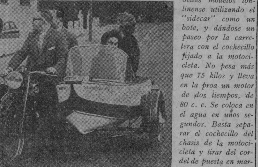
El "sidadar" anfíbio desarrolla una velocidad de once nudos por el agua. El motor se controla con un obturador maniobrado a mano, y la embarración se gobierna con una palanca montada en su centro; cuando se empuja a ésta hacia adelante, el bote tuerce a la derecha, y empujándola hacia atrás, gira en sentido contrario