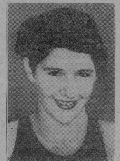
Dawn Fraser, campeona australiana de natación, que será la gran favorita en los Juegos Olímpicos de Roma

El anuncio de que el dirigente ruso padece de gripe, ha sido difundido por todas las emisoras de radio norteamericanas.—Efe.