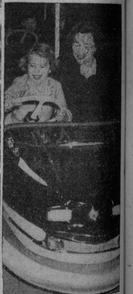
La princesa Ana de Inglaterra se divierte conduciendo un automóvil de choque durante su visita al famoso Circo Bertram Mills, en Londres. La princesita asistió junto con el príncipe de Gales, a la función de gala celebrada a beneficio de los Juegos Olímpicos y del Fondo Ecuéstreo Internacional