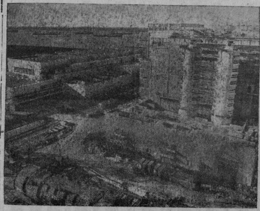
Otra central nuclear—una de las ocho que se han proyectado y se hallan en construcción en virtud del programa británico de energía atómica—está tomando forma en el estuario del Blackwater, en Bradwell, Inglaterra. A la derecha se ven, ya colocados en posición, dos cambiadores térmicos. En el suelo se ve el duodécimo y último cambiador que se erigirá. Se espera que la central de Bradwell, diseñada para producir trescientos megavatios, comenzará a generar electricidad en 1960

No hagas que tu limosna se pierda. Canalízala a través de Cáritas Española