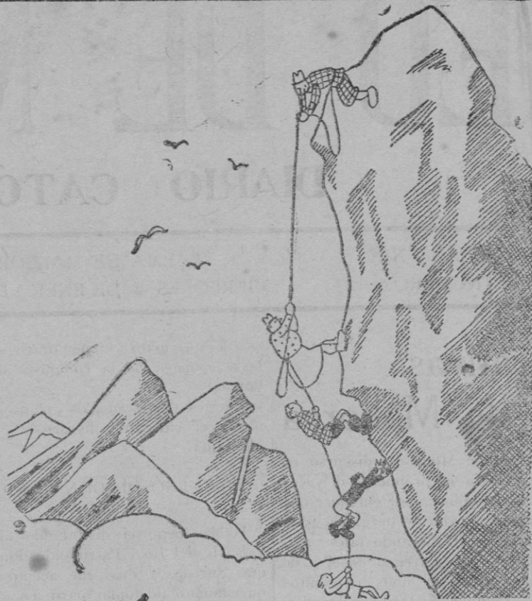
El amo y señor (desde las alturas). — ¡Las filigranas que tiene uno que hacer para mantener a pulso a una familia!

la destrucción casi instantánea de ciudades enteras.