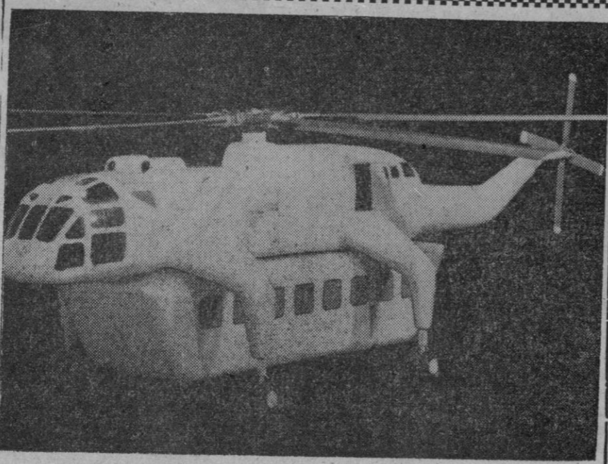
Nuevo helic6ptero para uso civil o militar que puede lo mismo volar por el espacio que rodar por una carretera, pudiendo alcanzar velocidades de unos 200 kil6metros por hora

Burdeos, 22.—Ha comenzado hoy en esta ciudad la primera sesi6n del juicio que se sigue contra el farmac6utico Jacques Casenave, fabricante de unos polvos de talco llamados «Baumol», que ocasionaron la muerte a 69 ni6os y lesiones graves a otros 234, al estar mezclados por error con ars6nico. Casenave comparece como responsable porque 6l dirigi6 la f6brica que produce el «Baumol» y se le acusa de homicidio culposo y lesiones graves causadas por imprudencia.—Efe.