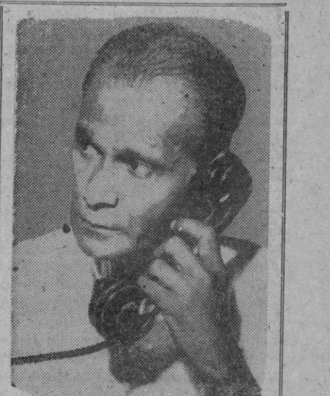
W. Dahanayake, que fue hasta ahora ministro de Educación en Ceilán y que ha sido nombrado ahora primer ministro

Serán los primeros proyectiles que se reciban en el Japón destinados a la fuerza japonesa de autodefensa.—Efe.