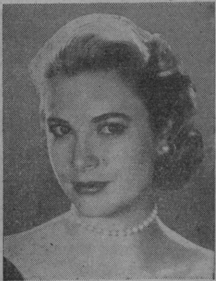
La princesa Grace

Esta mañana, como ya decimos en nuestra página de información local, han visitado nuestra capital los príncipes Raniero y Grace de Mónaco, quienes, después de visitar los monumentos segovianos y almorzar en nuestra ciudad, han marchado, a las cuatro de la tarde, con dirección a Pedraza. En el viaje, los príncipes van acompañados de su secretaria y del cónsul general del Principado en Madrid.