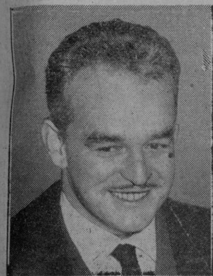
El príncipe Raniero

▲ A las cuatro de la tarde marcharon a Pedraza