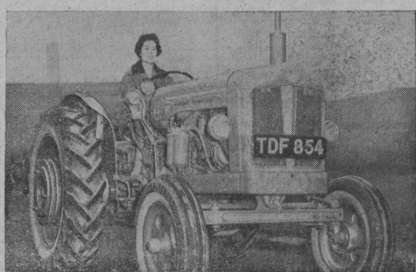
Tractor experimental «sin transmisión», de fabricación británica. Una sola palanca colocada justo al mando de dirección controla todos los movimientos de marcha hacia delante y hacia atrás. Desplazando la palanca hacia delante, aumenta la velocidad del tractor. Moviéndola en sentido opuesto, el tractor aminora la velocidad, se detiene—con las ruedas trabadas—y cambia de marcha. De esta forma, el tractorista puede cambiar de toda velocidad, adelante a toda atrás con un sencillo movimiento.

Los microbios fueron colocados en jarras llenas de nitrógeno a baja presión, como se supone a la atmósfera de Marte. Luego los organismos fueron expuestos a repentinos cambios de temperatura. Los organismos que requerían oxígeno murieron, pero los que necesitaban poco oxígeno sobrevivieron.—Efe.