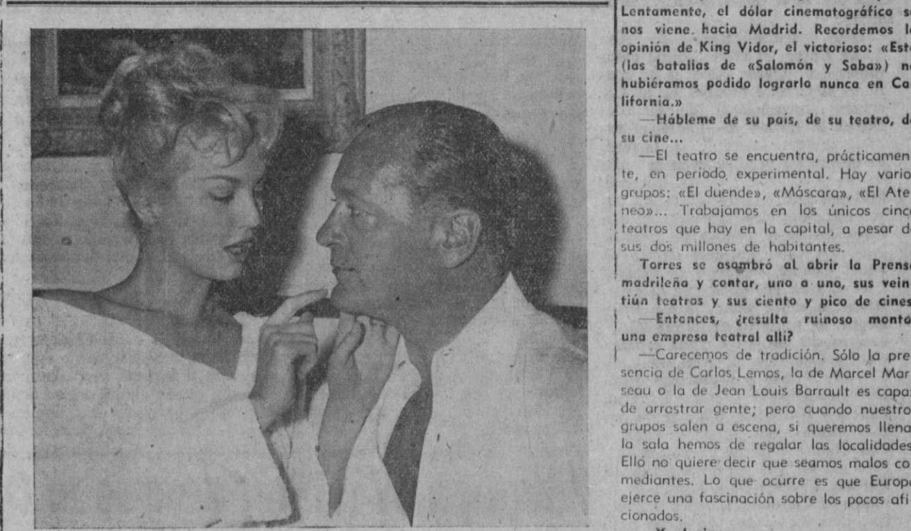
El famoso actor alemán Curt Jurgens, junto a la nueva estrella del cine francés Mylène Demongeot, en una escena del nuevo film de Yves Ciampi "Le vent se levé" (El viento se levanta)

—¿Por qué ha preferido Europa a Hollywood? —Europa tiene más calidad. Lo sabemos. Lo sabemos la mayoría de los españoles, pero nos empeñamos en