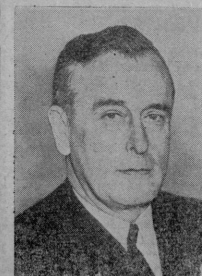
El lord Louis Mountbatten, nombrado jefe de Estado Mayor de la defensa británica

El Consejo de la O. E. C. E. aceptó ayer las proposiciones hechas por los países miembros del Mercado Común para la celebración de negociaciones bilaterales entre sus miembros, que pudieran llevar a evitar definitivamente la temida «guerra comercial».