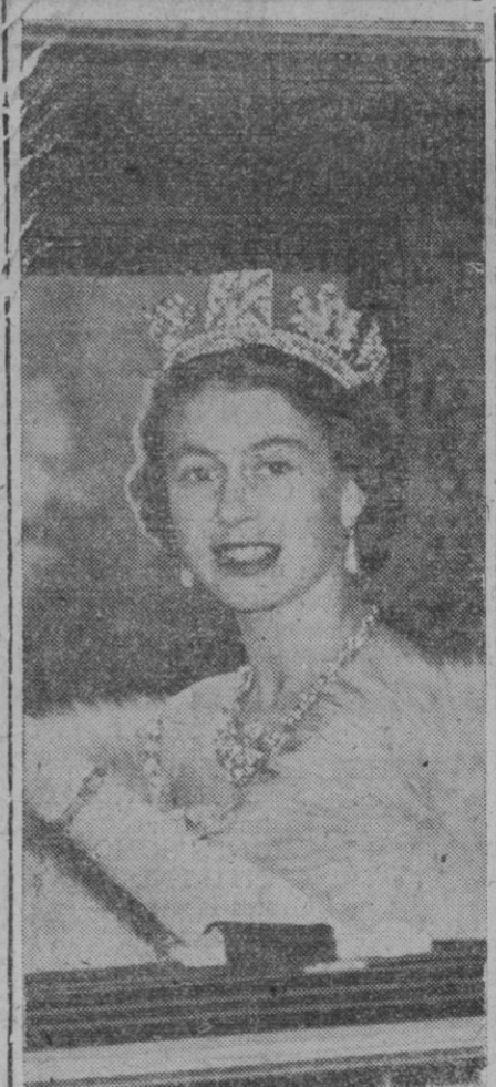
La apertura del Parlamento británico por la Reina Isabel II, que se celebrará este año el 28 de Octubre, será televisada por primera vez. La ceremonia se verá en toda Europa a través de la Eurovisión; las telegrabaciones y los servicios de ultramar de la BBC presentarán este solemne acto a otras muchas partes del mundo. La nota sobresaliente de la ceremonia es el discurso del Trono, que es preparado por el Gabinete y contiene el programa de trabajos del Parlamento para la próxima temporada, y, aunque es leído por la Reina, no significa que ella lo apruebe o lo desaprove.

Añadió que las perspectivas de paz en Formosa dependen de los comunistas. Agregó más tarde que es probable que facilite una declaración sobre su estancia en Taipei, a fines de la semana en curso.—Efe.