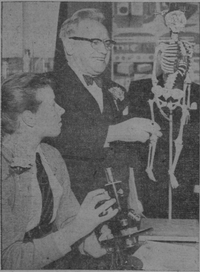
El diputado británico Mr. Herbert Morrison, en amigable charla con un alumno del laboratorio científico de la Escuela Sedgell, en Londres, que fue inaugurada por el citado diputado. Esta Escuela, con una capacidad para dos mil alumnos, ha costado en total seiscientos setenta y un mil libras esterlinas