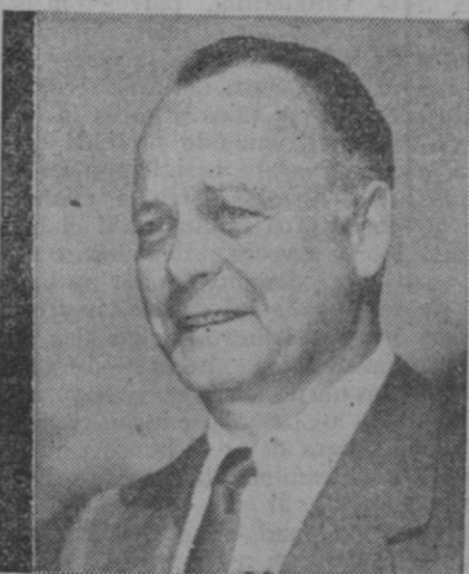
Fred A. Seaton, ministro norteamericano del Interior, de quien se habló estos días como sucesor de Sherman Adams en el puesto de consejero de Eisenhower, cargo para el que luego ha sido nombrado el general Willson B. Persons

Mientras tanto, el jefe del Gobierno se trasladó a Lyon para continuar su jira por las provincias francesas después de la victoria obtenida en el referéndum del pasado domingo.