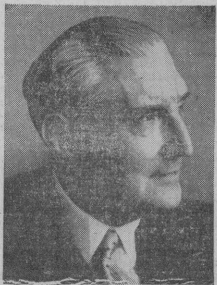
Oliveira Salazar, jefe del Gobierno en Portugal, cuya política ha representado un rotundo triunfo el resultado de las elecciones presidenciales celebradas ayer.

Madrid, 10.—Comunica la Inspección Central de Circulación y Transportes por Carretera del ministerio de Obras Públicas, que ha quedado cortado el tráfico, a causa del temporal de lluvias, por la carretera de Burgos a Portugal, por Salamanca, en sus kilómetros 209, 210 y 211, debiendo desviarse los vehículos entre Valladolid y el kilómetro 207 por la local de Valladolid a Cabezón, antes Valladolid y Santander.—Cifra.