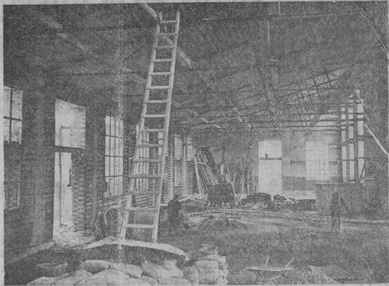
Una de las naves de la fábrica de A. Z. A. S. A., ahora ya casi terminada, en la que en muy breve fecha será instalada la modernísima maquinaria importada de los Estados Unidos

La concesión de estos títulos lleva consigo una serie de beneficios, entre los que destacan la concesión de materias primas intervenidas o procedentes de importación; preferencia para que