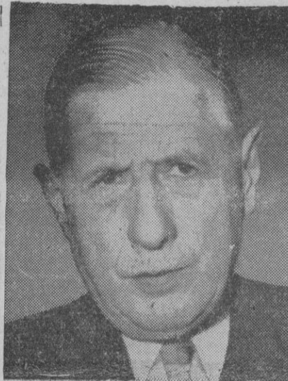
El general Charles De Gaulle, jefe del Gobierno francés

A la una de la tarde visitó el avión al ministro de Comercio inglés, mister Eccles, a quien acompañaba el embajador de su país, sir Ivo Mallet, y so-