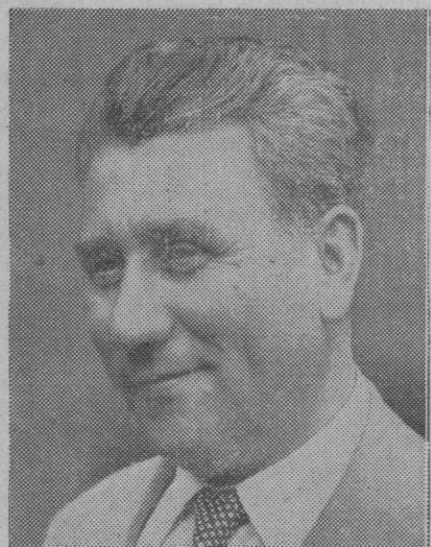
Alexander Rankovic, vicepresidente yugoslavo cuya valiente crítica de la U. R. S. S. ha provocado fuertes comentarios

Policía y grupos de salvamento se trasladaron inmediatamente al lugar del accidente, contemplando una escena pavorosa, con los restos de las víctimas esparcidos por las vías y entre los escombros.