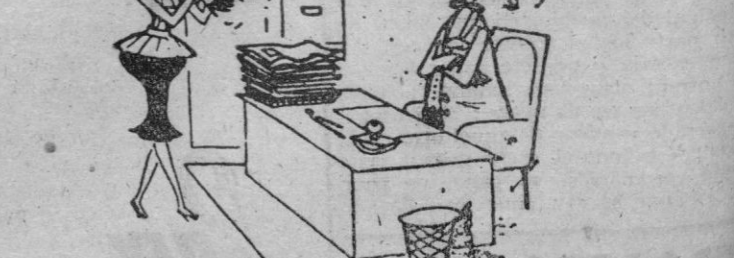
—Es que aún no se me ha secado el barniz de las uñas...

Preguntado Jean Rigaux acerca de si sabía por qué Dios había hecho al hombre antes que a la mujer, replicó: —Para dar al hombre un poco de tiempo en el que pudiera hablar.