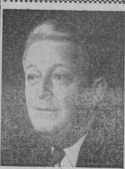
Sidney E. Smith, ministro canadiense de Negocios Extranjeros que representa a su país en la conferencia de la N. A. T. O. que está celebrándose en Copenhague