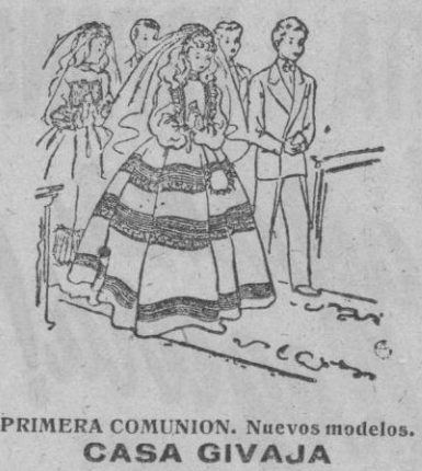
PRIMERA COMUNION. Nuevos modelos. CASA GIVAJA