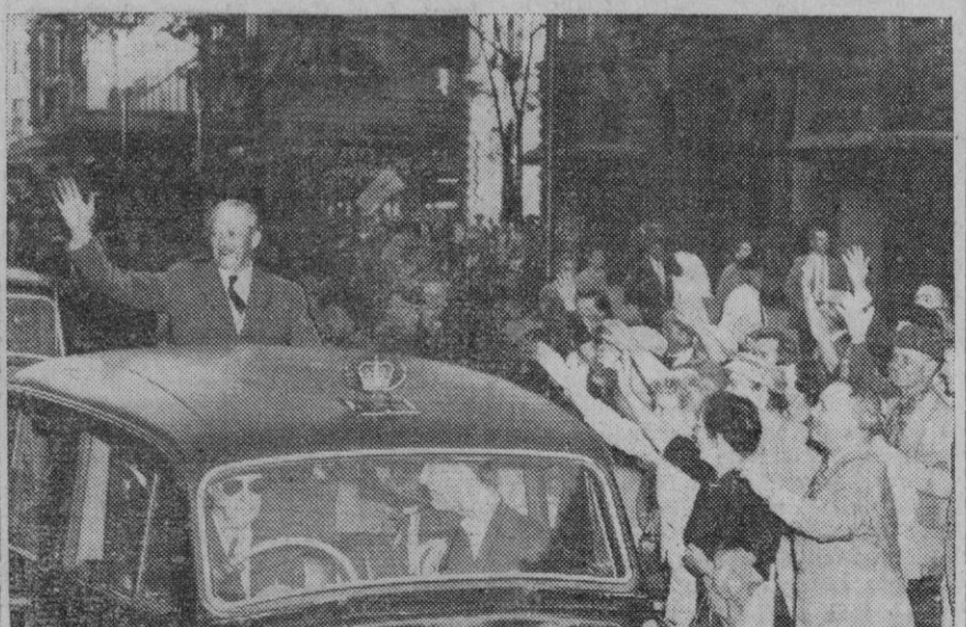
Durante su reciente gira por los países de la Commonwealth británica, Mac Millan recibió constantes aclamaciones, como muestra esta fotografía obtenida a su llegada a la capital de Australia

León, 14.—Se ha iniciado en la montaña el deshielo de la nieve, pero con mucha lentitud, ya que hasta ahora las lluvias han sido muy escasas, pues en las últimas veinticuatro horas sólo se registraron tres litros de agua por metro cuadrado. El deshielo más bien proviene del aumento de la temperatura, que no ha bajado, por las últimas 24 horas, de los siete grados.—Cifra.