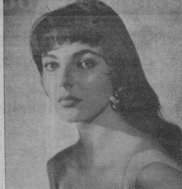
De la misma manera que han hecho otras actrices inglesas, Joan Collins marchó a Hollywood para aparecer en la película «El sexo opuesto» de M. G. M., y ha continuado en América en plena actividad cinematográfica. Es de resaltar que no obstante su procedencia británica, Joan es morena como una sevillana