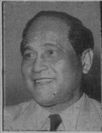
Carlos P. Garcia, nuevo presidente de Filipinas

La caracterización a la que alude el párrafo anterior se refiere a los que ejercen acto de dirección o representación, en su defecto, a la participación, conducta y antecedentes, a juicio de los tribunales, en relación con la naturaleza y circunstancias del hecho.