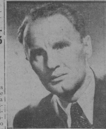
János Kadar, jefe del Gobierno rojo de Hungría, que pretende a todo trance la pacificación del país sin conseguirlo

León, 17.—Debido al temporal de nieve, que continúa sin interrupción en la montaña, aunque hoy ha disminuido algo, han quedado cerrado al tránsito los puertos de San Glorio, en la carretera que comunica esta provincia con la de Santander, y Somiedo, que comunica el de Haba con la de Asturias. En la parte baja de la provincia, y en la ciudad, no ha nevado.