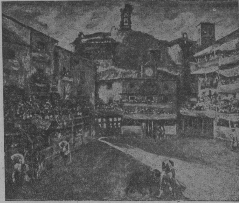
"Toros en Sepúlveda", cuadro de Lope Tablada lleno de luz y color recién salido de su paleta

Desaba conocer a Lope Tablada desde hace varios años. Había visto su pintura, inquieta y serena a la vez, y tantas eran—y tan diferentes—las versiones que se me habían dado de este pintor de Castilla, que me resultaba una incógnita con urgencia de solución inmediata.