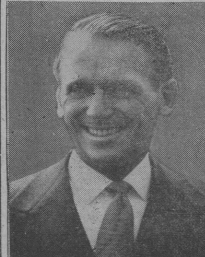
Douglas Fairbanks, el célebre actor del cine americano, quien según los rumores sucederá a Mrs. Booth-Luce en el cargo de embajador norteamericano en Italia