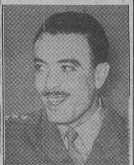
El teniente coronel Ali Abu Nuwar, de 33 años, que sucede a Radi Innab—sucesor a su vez de John Glubb— como jefe de la Legión Árabe en Indochina

que una delegación económica yugoslava ha llegado a Moscú para negociar la ayuda técnica y financiera de Rusia a Yugoslavia sobre la base de un crédito por valor de 110 millones de dólares.—Efe.