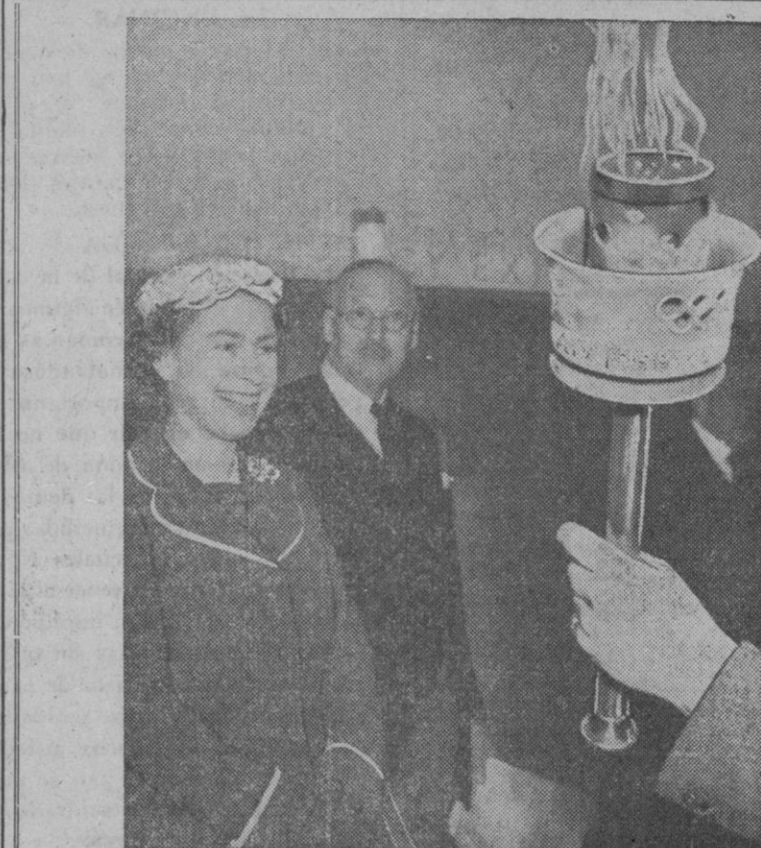
Durante la visita hecha por la reina Isabel II y el duque de Edimburgo a la Feria de las Industrias Británicas, la sobeana examinó una de las antorchas que servirán para llevar la llama del monte Olimpo de Grecia al estadio de Melbourne, donde se celebrarán los Juegos Olímpicos de 1956

El comercio turístico se ha convertido en Italia, a raíz de la terminación de la guerra, en una de las mayores fuentes de ingresos. En 1955 registró Italia la cifra «records» de 10.000.000 de turistas; los visitantes gastaron varios millones de dólares.—Efe.