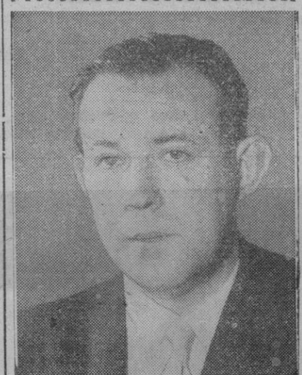
Poul Hausen, nuevo ministro de Defensa Nacional de Dinamarca

Asistieron al acto el marqués de Luca de Tena, que presidia la Junta quien pronunció palabras de ofrecimiento; duque de Alba, escultor y académico señor Azuara, el alcalde, varios concejales, cronistas y altos jefes de la Corporación. El alcalde dió las gracias por el ofrecimiento de la obra y dijo que con ella se enriquecía el tesoro del Ayuntamiento. Después se procedió a buscar el emplazamiento adecuado dentro de la Casa Consistorial.—Cifra.