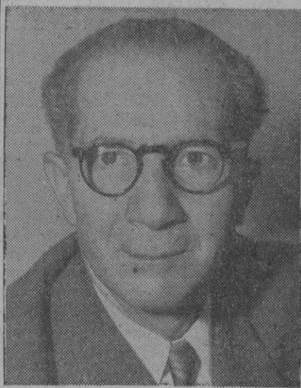
Samir Rifai, nuevo primer ministro de Jordania

Se ha celebrado hoy con el ceremonial acostumbrado, en el Palacio de Oriente