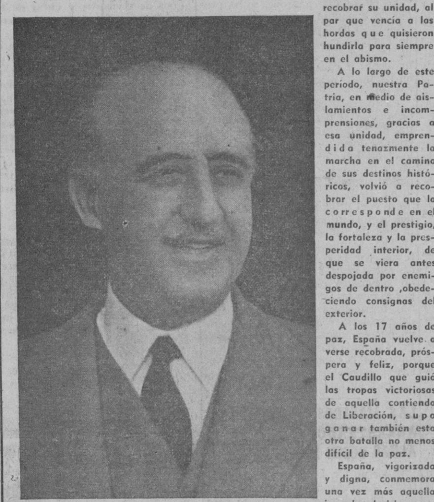
fué algo más que una fecha de su Historia. Un momento trascendental en el que empieza pujante y potente este resurgir cada vez más esplendoroso de la Patria, que tiene el sello de la justicia social y la unidad, grandeza y libertad de la Patria como ideas básicas y fundamentales de la Cruzada felizmente coronada en aquel 1.º de Abril de 1939.

Hoy transcurrido ya desde aquel 1.º de Abril de 1939 diecisiete años. Diecisiete años de paz desde aquella fecha gloriosa de la Victoria con la que España volvió a recobrar su unidad, al par que vencia a los horros que quisieron hundirla para siempre en el abismo.