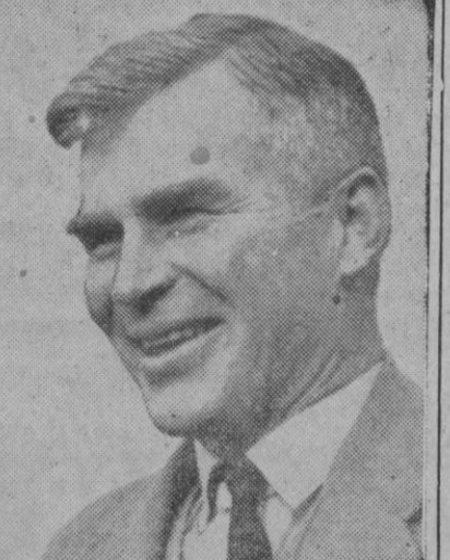
Doctor Vivian Fuchs, jefe de la importante expedición británica que intentará explorar los inmensos territorios de la Antártica

Jerusalén, 3 (madrugada).—Una fuerza militar compuesta por unos treinta mil hombres ha empezado a concentrarse en la región comprendida entre el Canal de Suez y la frontera con Israel, según se informa en fuente israelí.—Efe.