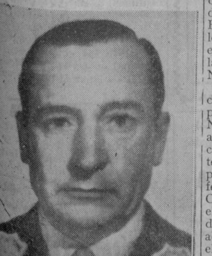
Pedro Aramburu, nuevo Presidente de la Argentina