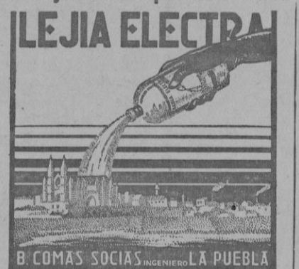
B. COMAS SOCIAS INGENIEROS LA PUEBLA

No hay mancha que resista a la LEJIA ELECTRA