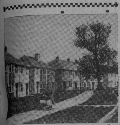
Una calle de cualquier pueblo del mundo, bonita, tranquila y en la que completa la estampa el arbolito y la señora con el coche del pequeño

Asistieron también varios ministros y otras personalidades