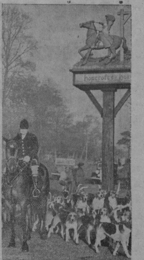
Las jaurías marchan a la caza del zorro, partiendo reunidas desde el poste indicador de una hostería tan antigua como interesante en la historia local de cierto pueblito inglés

Nueva York, 19.—La película «Love is a many splendored thing» («El amor es la cosa más espléndida»), ha sido estrenada hoy en Nueva York con gran éxito. Trata de las peripecias de un corresponsal de prensa en Hong Kong. El papel femenino está interpretado por la actriz Jennifer Jones, que aparece como una muchacha asiática, y el papel masculino