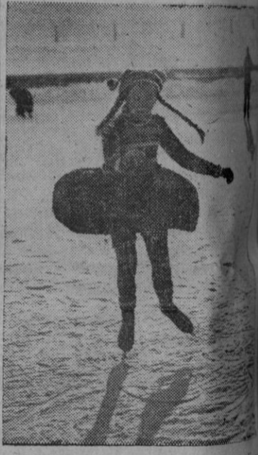
También las niñas sienten su atracción por el patinaje. Además, una niña hay que comenzar cuando quiere llegar a ser artista de deporte y arte, y deslizarse con seguridad sobre la pista de hielo.

El número de vehículos que cruzaron la frontera es: día 13, 3.500; día 14, 3.450; día 15, 3.200; y día 16, 3.200.—Efe.