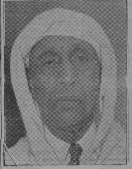
El Glau, poderoso bajá de Marrakech, que ahora combate los planes gubernamentales franceses sobre Marruecos