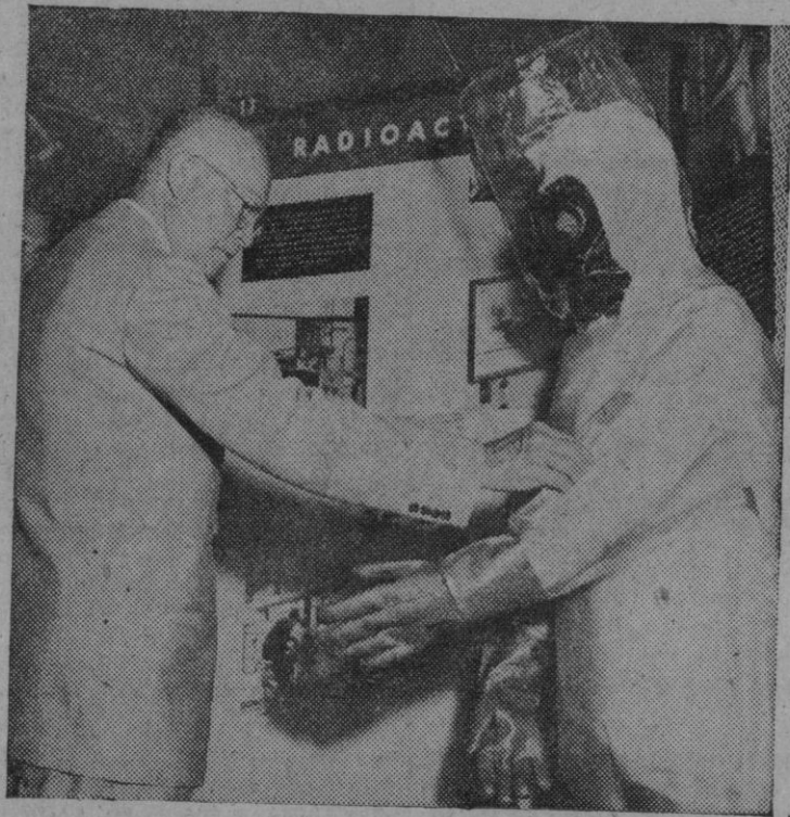
El Presidente Eisenhower inspecciona un traje protector de plástico durante su visita a la exposición sobre energía atómica celebrada en la biblioteca del Congreso de los Estados Unidos. Esta exposición ha sido preparada por la Oficina de Información de los Estados Unidos para ser presentada en el extranjero como parte del programa de Eisenhower "átomos para la paz"