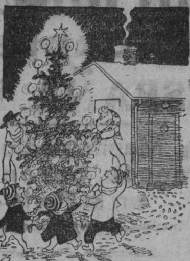
—¿Por qué hemos de tener un árbol de Noel tan grande, si no cabe en el salón?