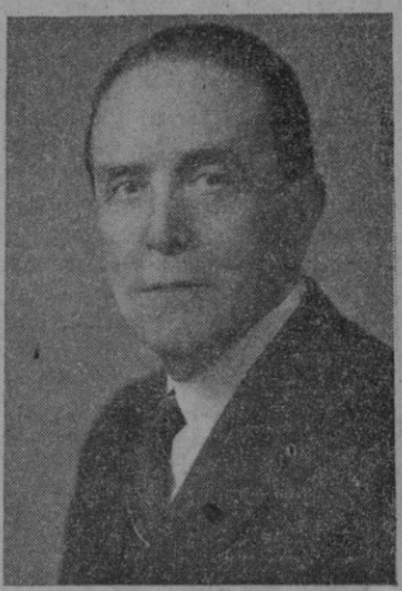
El insigne médico segoviano don Teófilo Hernando

Pluma 22. Pluma 22. Pluma 22. Pluma 22. Pluma 22. Pluma 22. Pluma 22. La máquina más completa en portátil de poco peso; tiene bicolor. 90 y 100 espacios; estuche plástico contado 3.200. Muchas facilidades de pago. Pluma 22 Hispano Olivetti. Alberto González. San Francisco, 23.