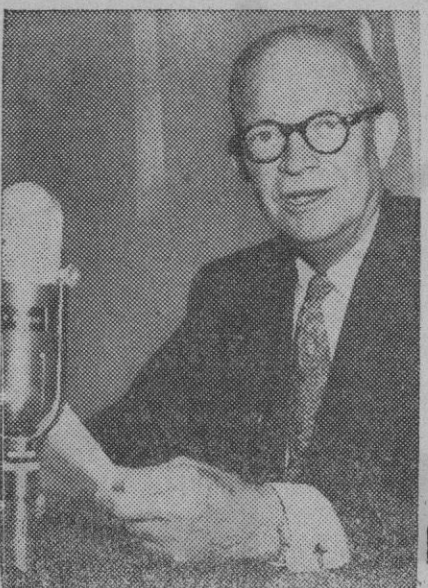
Eisenhower se dirige a la nación norteamericana con uno de sus frecuentes discursos y mensajes. Ante él, el micrófono de la radio captando sus palabras. Y en su rostro, su habitual sonrisa. Recientemente ha pronunciado su tradicional mensaje de Navidad, haciendo referencia a la situación mundial.

Contra el Gabinete votaron los comunistas y otros setenta diputados de diversas filiaciones.—Efe.