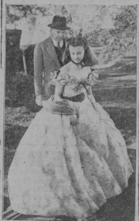
Nos suponemos que con este nombre ya la reconocerán nuestros lectores. Claro que la escena es de hace tiempo. Entonces Vivien Leigh acababa de ser designada en Hollywood para interpretar el papel de tan famosa película