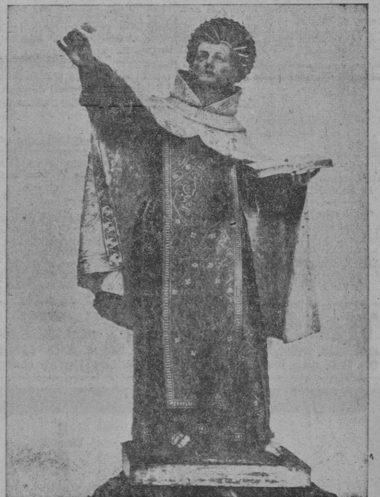
San Juan de la Cruz. (Escultura de Gregorio Hernández)

¿Quién requerebró más su dicha? ¿Qué amor de carne y de sangre supo gozar de tu Gozo, y así quemar sus cantares? ¿Quién celó tus hondos celos? ¿Quién supo trenzar el aire para escalar hasta el Júbilo, temblando de eternidades? ¿Quién tuvo un ascua más roja en el verbo alucinante? ¿Quién supo la Fuente Viva aunque la noche era grave? ¿Quién durmió en las azucenas más ancho olvido inefable? ¡Ay, Juan de la Cruz, qué solo con el Amor te quedaste!