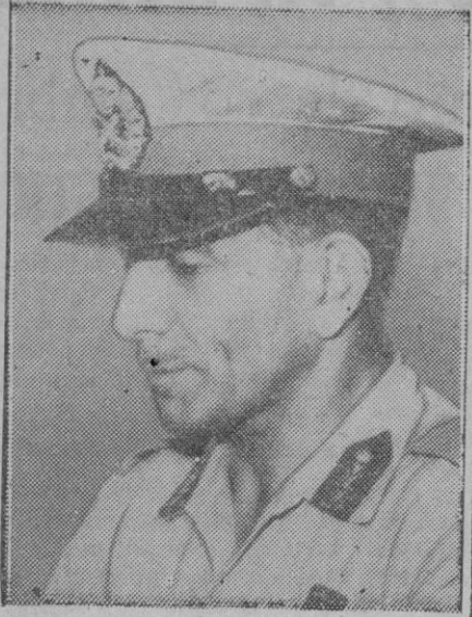
Naguib, ex presidente egipcio

Se le acusa de connivencia con la Hermandad Musulmana para derribar a NASSER