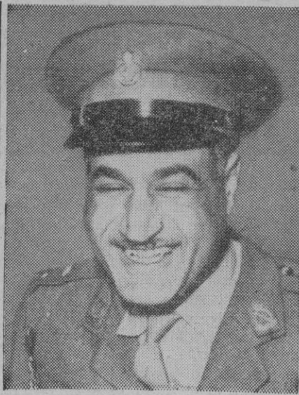
Nasser, jefe del Gobierno

DESPUES DE PROCLAMARSE TAL MEDIDA, EL MINISTRO DE ORIENTACION NACIONAL, SALAH SALEM, HA DECLARADO QUE NAGUIB NO SERA SOMETIDO A JUICIO.