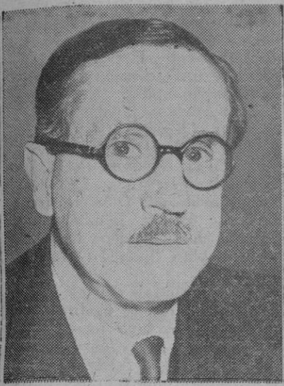
Sir William Strang, inglés, que ha sido designado primer comisario europeo en el Sarre

ADENAUER se ha reunido apresuradamente con su Gobierno