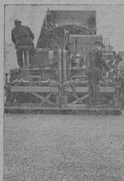
Una máquina muy útil. Sobre todo para algunos lugares. Se dedica, con gran aprovechamiento, según nos aseguran, para el arreglo de la superficie de carreteras. Si la "pesáramos" en la provincia de Segovia, ¿eh?

Nueva York, 4.—Pierre Huss publica en «Journal American» un interesante artículo acerca del papel de España en la defensa de Occidente. Huss es redactor diplomático de la Prensa Hearst. El título del artículo es «Nosotros podemos contar con España», y en él pone de relieve que si la llegada de Alemania occidental a la defensa de Europa constituye una página en la historia postbélica, no es menos importante para el mundo libre el resurgimiento de España como un país aliado de Occidente. «Los lazos con España—dice—se hacen cada día más valiosos a medida que Yugoslavia da signos de derivar otra vez hacia el camino de Moscú.»—Efe.