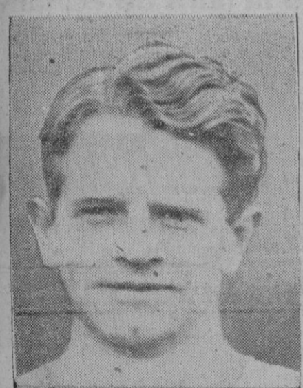
Chris Chataway, el corredor inglés que ha establecido recientemente un nuevo récord mundial para los cinco mil metros, venciendo al atleta ruso Vladimir Kuts