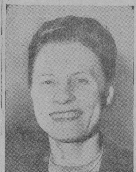
La doctora Edith Summerskiel, que acaba de ser elegida presidente del partido laborista inglés